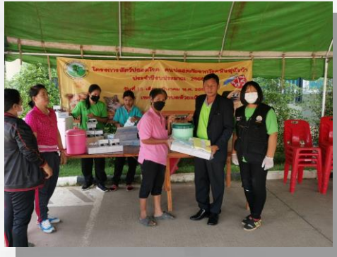
๓.๔ โครงการส่งเสริมการประกอบอาชีพของผู้สูงอายุ ได้รับสนับสนุนงบประมาณจาก สำนักงานกองทุนสนับสนุนการสร้างเสริมสุขภาพ (สสส.)